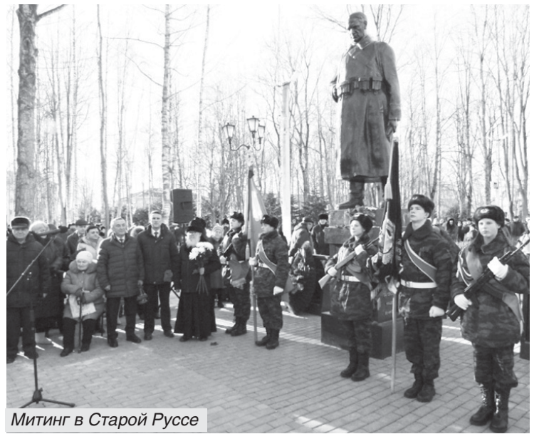
Митинг в Старой Руссе

• 4 февраля в Холме состоялось торжественное открытие мемориальной доски Герою Советского Союза Василию Челпанову. Выпускник Холмской средней школы,